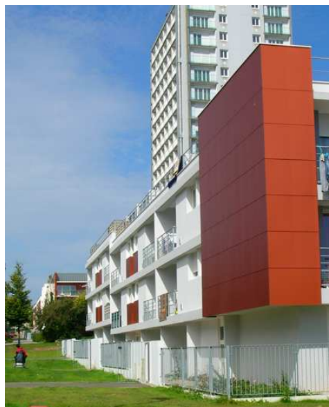
Brest- Pontanezen- 26 logements

Au côté des collectivités locales, les organismes d'habitat social bretons apportent toutes leurs compétences, leur ingénierie et leurs financements pour répondre aux objectifs de renouvellement et de diversification de l'offre.