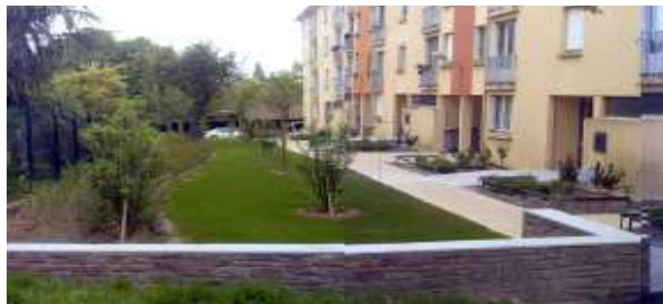
Rennes—résidentialisation 1 à 7 square du Gast