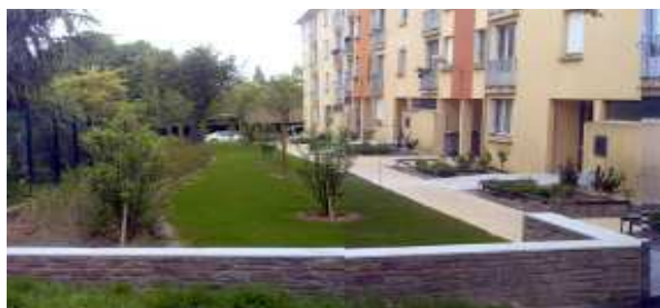
Rennes—résidentialisation 1 à 7 square du Gast